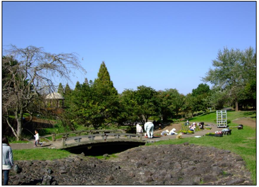
週末にはたくさんの家族連れ（上：七井戸公園） お買い物ついでに、ランチ休憩も嬉しいマーケットプレイス(下写真)

今回は身近な散策コースとして『染井野地区』を取り上げました。 地区内には『七井戸公園』と『吉見台公園』それに『染井野調整池広場』と三つの大きな公園があります。 また、それぞれの丁目ごとに、①つきのき②えのき③しらかし④みずき⑤にれのき⑥ねむのき⑦すずかけ、そして⑧ゆりのき公園があり、憩いの場となっています。