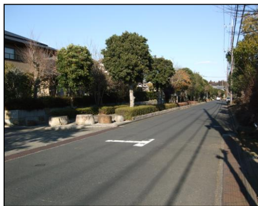
緑が美しい染井野の街並み（三丁目）

編)集)後)記) あの震災から、一年が経ちました。日本はたくさんのものを失い、そして学びました。あらためて命の尊さそして、人の絆を再確認しました。毎日を大切に、そしてみんなと共に生きていこうと思います。