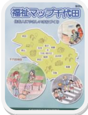
福祉マップ千代田発行 障がい児者福祉事業部