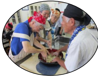
男の料理教室 (蕎麦打ち) ボランティア事業部