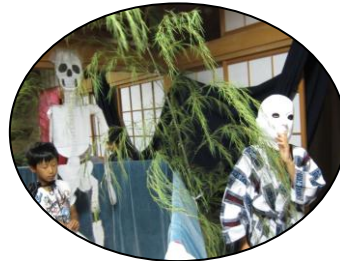
夏休み親子お楽しみ会 児童福祉事業部