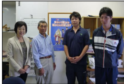
読売センターうすい.N.Tの方々と 大蔵会長(左端)