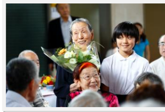
敬老会 地域福祉事業部