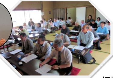
福祉委員研修 研修事業部