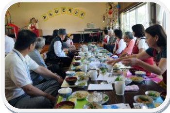
みんなでランチ 高齢者福祉業部