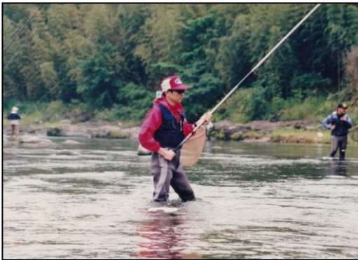
初めての鮎釣り…さっそう？と見えるのは そのはず、人間以外はすべて新品！

長良川の鵜飼いはご存知の方 が多いと思う。かがり火をたき、 光に寄って来た鮎を訓練した鵜 に獲らせて、丸呑みした鮎を吐き 出させる方法だが、素人にはでき ない。川に側路をつくって板や竹 で作った築 やな に追い込んで手づか みにする方法もある。川に段差が ある場所で、上流に向かって飛び 跳ねるところを網でキャッチす る素朴な方法もある。