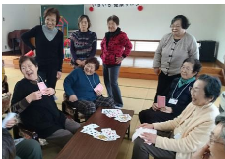
久しぶりのトランプ、ハハはどこに?

ご覧ください) 畳の上において、その上をマスの枠を踏まないようにステップしていくものです。だんだんステップも複雑になり、更に手の動きも加わり、それでも皆さん軽やかにあるいは慎重に3人並んで端まで歩くと待っている方達とハイタッチ! 楽しく体を動かした後は大広間から和室のテーブル席に移動して、来年の干支の酉にちなんで折り紙でニワトリを折りました。そしてそれを色紙に貼り、新しい年の希望や目標を書いていただきました。私達スタッフも色紙作りに参加して、それぞれ一言ずつ目標などを書いてみました。出来上がった色紙の皆さんの言葉を繋いでいくと、 笑顔で微笑みを忘れず、健康に留意し風邪をひかず、元気に羽ばたきながらも(重くて? 飛べない人は) こつこつと歩いて前進し、恒久平和を祈り、仲良く家内安全を願う!