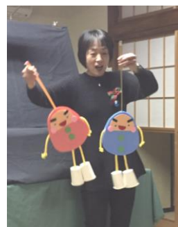
クリスマス会のお楽しみ