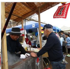
焼きそばとわらび餅 大人気でした

上げました。又わらび餅作りは別会場で朝8時から行われ、32鍋220食を練り上げました。フリマに品物を提供して下さいました。方々も、ご協力ありがとうございました。 今回は初の試みとして、土曜日開催で日曜日を予備日とする事になりました。会場準備の時間が以前よりも短くなり、主催者の皆さんには大変なご苦労があったことと思います。色々な形で参加された方々を含めて皆さんお疲れ様でした。 子供たちの笑顔がお祭りには一番ぴったりですね。 (広報事業部 高椋雅子)