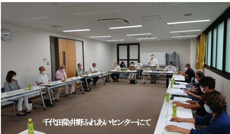
千代田染井野ふれあいセンターにて