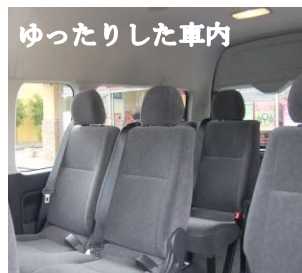
ゆったりした車内