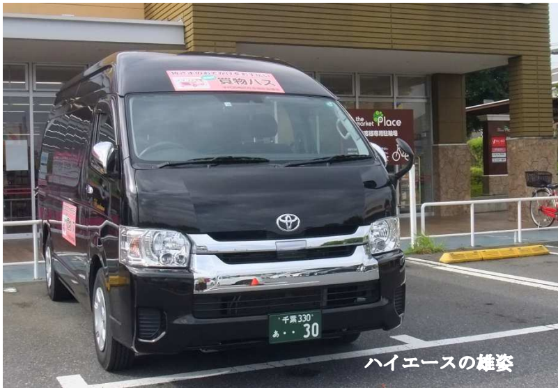
ハイエースの雄姿