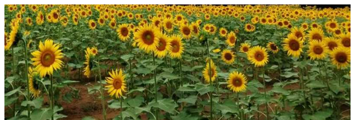
佐倉西部自然公園 (仮称) のひまわり畑 (畔田地区)