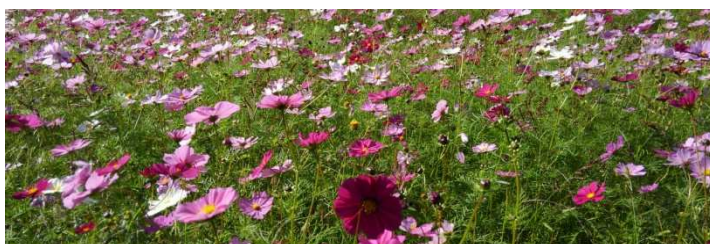
手繰川沿いに数百メートル続くコスモス畑 (生谷地区)