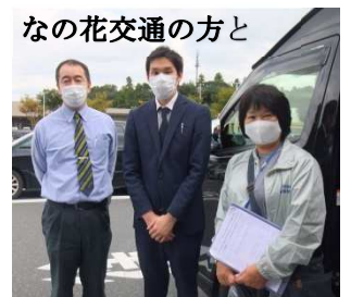
なの花交通の方と