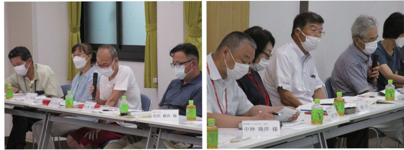
7月2日、対面で全員一堂に会することができました

千代田地区社協としては、染井野の一部町内会の協力を得て、民生委員を含めて三者で、日常生活における見守りを第一歩とし、大規模災害時等での実質的な「避難行動要支援」に結び付けて行けるような取り組みを始めていることを紹介し、他地域でも進めていいただきたい旨、代表者の方々にお願いをした。 その他の課題等については、時間の制約もあり、あまり活発な議論が出来なかったものの、いくつかの町内会からの情報として、「住民の高齢化による自治活動の停滞または困難度合いの増加」が喫緊の課題として存在していることが、伝えられている。