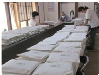
279袋を用意しました