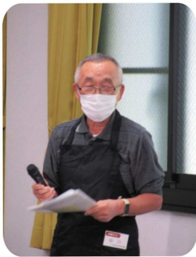
「木曜カフェ開店です！」

木曜カフェは地域の皆様に愛されて行ってきましたが、折からのコロナ禍の中で飲食の提供を伴うため、やむなくこの2年半余り休業を余儀なくしました。ただこの間、スタッフ一同、様々な検討を重ね、地域の方々の学びの場としても提供できるよう、白井・千代田地域包括支援センターの協力のもと、開店することができた運びとなりました。