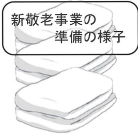
今年も又 ふわふわタオルを お届けしました