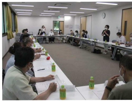
千代田・染井野ふれあいセンターにて

千代田地区社協の沿革、規模、主要行事等の説明を行い、従来は、各地区の困りごと、課題等をお聞きしていたが、今年度は、「避難行動要支援者名簿の活用について」を懇談の主要テーマとして取り上げた。当然の事ながら、地区により名簿への対応はまちまちで、なかには、名簿の存在を知らない地区もあり、知ってはいるものの、世帯数が少なく、地域内については把握しているので必要性を感じられないとする地区もあった。また、これらの地区を含めて、自治会、町内会、区に所属していない世帯へのアプローチをどうするかを課題として取り上げた地区もある。