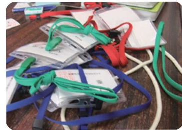
名札を付けて伺いました