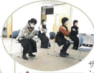
スクワットは ゆっくりと