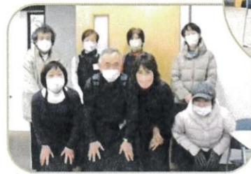
カフェスタッフさん 集合で〜す