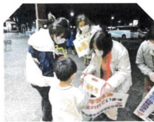
ボクもママと一緒に

今回は「子ども食堂の支援」と「学習支援」をテーマに行いました。頂いたお金の使い道を掲示して具体的にお伝えし、より多くの方から共感を頂きまして。わざわざ引き返して募金して下さった方もおられました。 今後、用途を具体的にお伝えしていきたいと思えます。より一層のご協力を頂けるよう努めたいと思います。 (事務局)