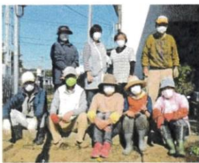
休憩時のお喋り。健康や地域の情報交換に花が咲きます。