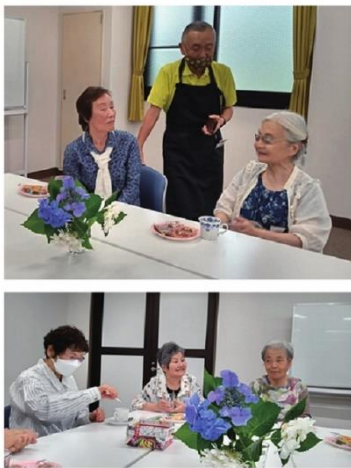
6月15日の様子 地域の方が紫陽花をお持ちくださいました。 テーブルが華やかになりました。